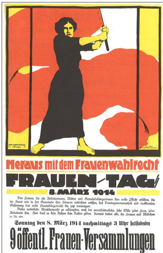
Plakat der Frauenbewegung zum Frauentag 8. März 1914

Nicht nur auf der rechtlichen Seite entscheiden immer noch überwiegend alte Männer über die Lebensgestaltung von Frauen, auch gesellschaftlich ist es immer noch bittere Realität, dass sich fest an Geschlechtsterror klammert wird.