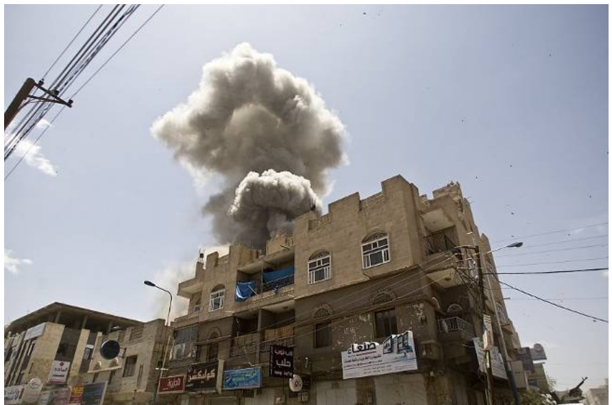
Luftbombardement von Sana'a, Jemen

Mittlerweile scheint die Bundesregierung auf eine restriktivere Exportpolitik umgeschwenkt zu sein. Den nach der Ermordung des Journalisten Jamal Khashoggi beschlossenen Ausfuhrstopp für Rüstungsgüter an Saudi-Arabien hat sie jüngst bis Ende 2021 verlängert. Freilich macht das die vielen bereits durchgeführten Waffengeschäfte nicht ungeschehen.