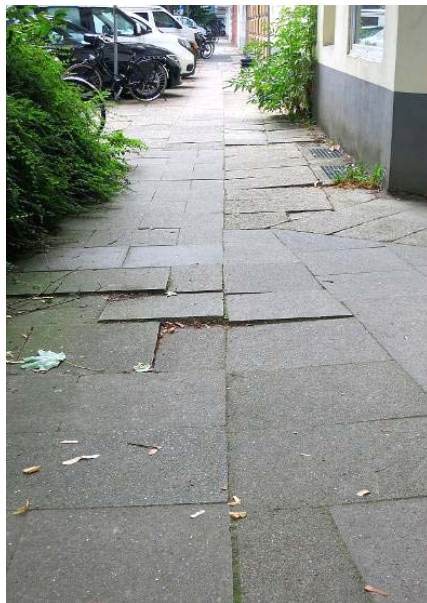
Bild Seite 4: Fußwegsituation im Weckmannweg 1; Bild Seite 5: Stolperfalle vor Pflegestation Ecke Grundstraße/Lappenbergsallee. (Fotos: D. Schlanbusch)

Herbert Oetting, Annegret Ptach AG 60plus Eimsbüttel