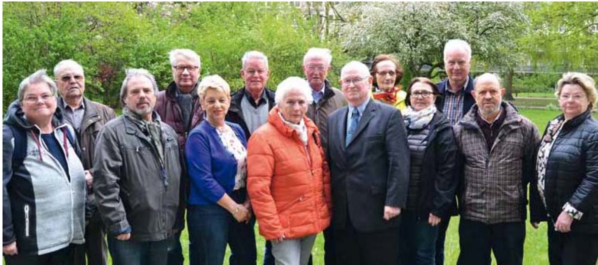
Der derzeitige Seniorenbeirat des Bezirks Eimsbüttel

In 2021 stehen wieder die Wahlen zu den Seniorendelegiertenversammlungen in den Bezirken an, die dann die Bezirks-Seniorenbeiräte (BSB) wählen. Aufgrund der Corona-Pandemie wurden die Wahlen um drei Monate verschoben – mit dem Vorbehalt, sie nochmals, je nach Lage der Situation, um weitere drei Monate zu verschieben. Ein entsprechendes Schreiben ist dazu an alle BSB- und SDV-Mitglieder versendet worden.