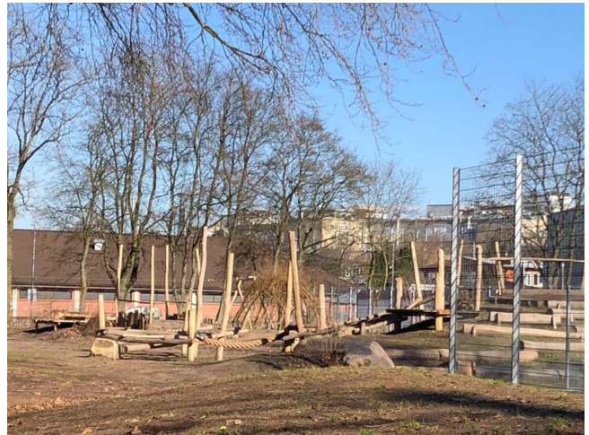
Umgestalteter Schulhof der Schule Lutterrothstraße 34/36. Bald ein Freizeitangebot für alle?

Dort, wo der ehemals vorhandene kleine Sportplatz zu einer Art Abenteuer-spielplatz umgebaut wurde, sollten wir eine Nutzungsmöglichkeit finden, die die Interessen aller Kinder im Stadtteil und der Schule verbinden.