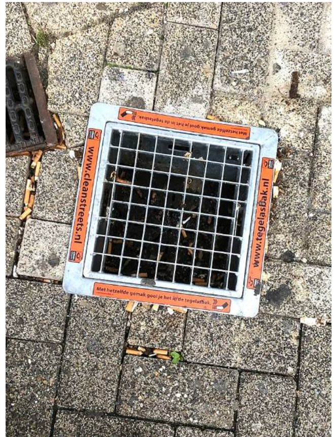
Ein Kippen-Gully in Venlo, Niederlande. - Ab und zu fällt eine Kippe noch daneben; die meisten landen aber treffsicher im Bodenaschenbecher.