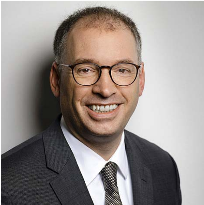
Unser Bundestagskandidat Niels Annen (MdB)

Melanie Leonhard zu Gast bei Niels Annen