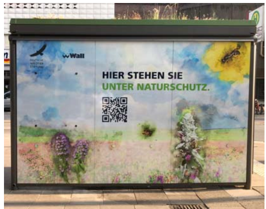
Der Fahrgastunterstand an der Bushaltestelle Osterstraße

Ich möchte euch gern von einer kleinen Veranstaltung an der Bushaltestelle in der Osterstraße 102 berichten. Hier ist seit einem Jahr ein Haltstellendach bepflanzt, um Lebensraum für Wildbienen anzubieten. Die Firma Wall und die Deutsche Wildtier-Stiftung haben gemeinsam dieses Projekt initiiert. Wildbienenexpertinnen der Stiftung informierten vor Ort über die ersten Projektphasen. Inzwischen konnten 50 verschiedene Wildbienen nachgewiesen werden, was selbst die Verantwortlichen überraschte.