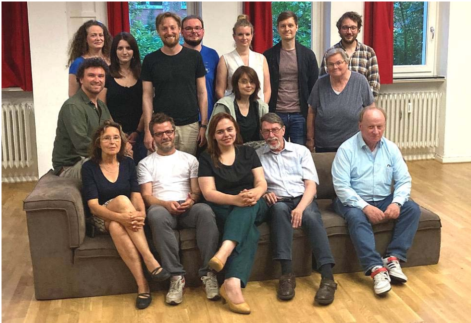
Frisch gewählt: Der neue Vorstand der SPD Eimsbüttel-Nord.