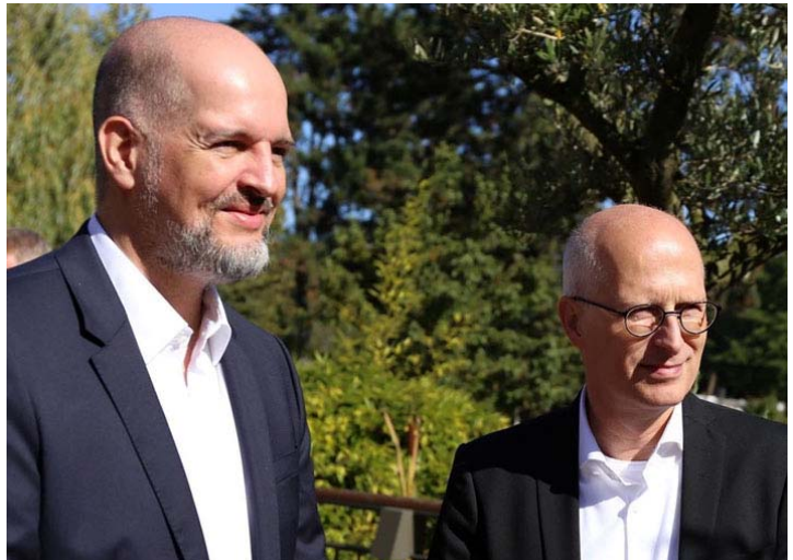
Milan Pein (li.) mit Bürgermeister Peter Tschentscher

Wenn am 23.02.2020 die neue Bürgerschaft gewählt wird, dann geht es darum, wer zukünftig den Kurs der Stadt bestimmt und seine Ideen und Visionen für die Zukunft umsetzen kann. Keine Frage, wenn es nach uns geht, soll die SPD stärkste Kraft bleiben und Peter Tschentscher weiter Bürgermeister sein.