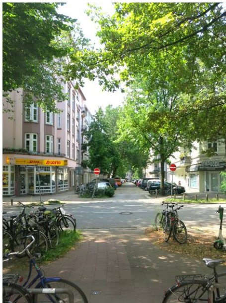
Der Weckmannweg zwischen Rellinger Straße und Lappenbergsallee

Die beiden Sichtweisen zu vereinen scheint bisher ein unmöglicher Spagat. Doch mit Mut und Umsicht lässt sich diese Idee gestalten: mit einer breit angelegten Beteiligung und Befragung, die sämtliche Stimmen und Bedarfe im Stadtteil berücksichtigt – von den Wünschen der Schüler*innen bis zu denen, die auf das Auto angewiesen sind. Nur auf solcher Grundlage ist eine gerechte Abwägung der Interessen und weitere Planungen möglich. Woran die Idee noch scheitern kann? Der Durchgangsverkehr müsste aus dem Quartier gehalten werden. Hier müssen wir ansetzen – und können bereits erste Pflöcke einschlagen: Tempo 30 auf der Strecke Langenfelder Damm / Lappenbergsallee.