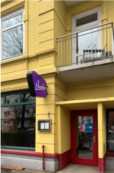
Die Auster-Bar an der Ecke Sillem- und Methfesselstraße

Eimsbüttel Nord ist in Bewegung – und das im besten Sinne. In den vergangenen Monaten hat sich die gastronomische Landschaft unseres Quartiers sichtbar weiterentwickelt. Neue Orte sind entstanden, bestehende haben sich vergrößert oder verändert. Ob die stilvolle Cocktailbar Rye and Dry, das beliebte Café Studio Gusto oder die Auster Bar, die vom Henriettenweg in die Methfesselstraße umgezogen ist und dort bereits viele neue Stammgäste gewonnen hat: Sie alle stehen beispielhaft für die Lebendigkeit und Kreativität, die unseren Stadtteil auszeichnen.