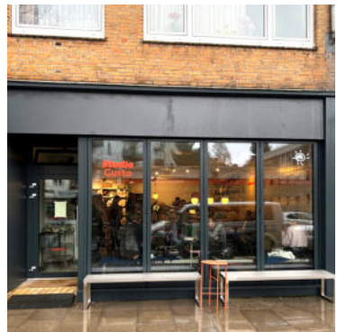
Die Café-Bar Studio Gusto in der Methfesselstraße

Diese Entwicklung zu begleiten, zu gestalten und dabei alle Interessen im Blick zu behalten, bleibt eine wichtige Aufgabe für die Zukunft. Denn ein lebendiger Stadtteil ist kein Selbstläufer – er lebt vom Engagement seiner Gemeinschaft und von einer Politik, die die richtigen Impulse setzt.